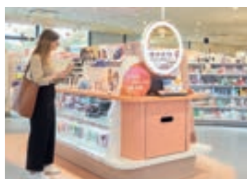
Entdecken Sie die neue Ladeneinrichtung im Gifhorer dm-Markt in der Braunschweiger Straße.

Service, kompetente Beratung und Familienfreundlichkeit werden bei dm groß geschrieben. Die dm-Teams stehen Ihnen bei Fragen rund um die Produkte gerne zur Seite und informieren