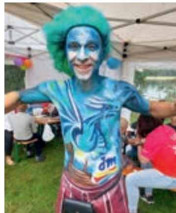
Bunter Stelzenläufer sorgt beim Cup für leuchtende Kinderaugen.

Am Samstag, 31. August, 9 bis 16 Uhr und am Sonntag, 1. September, 9 bis 15 Uhr.